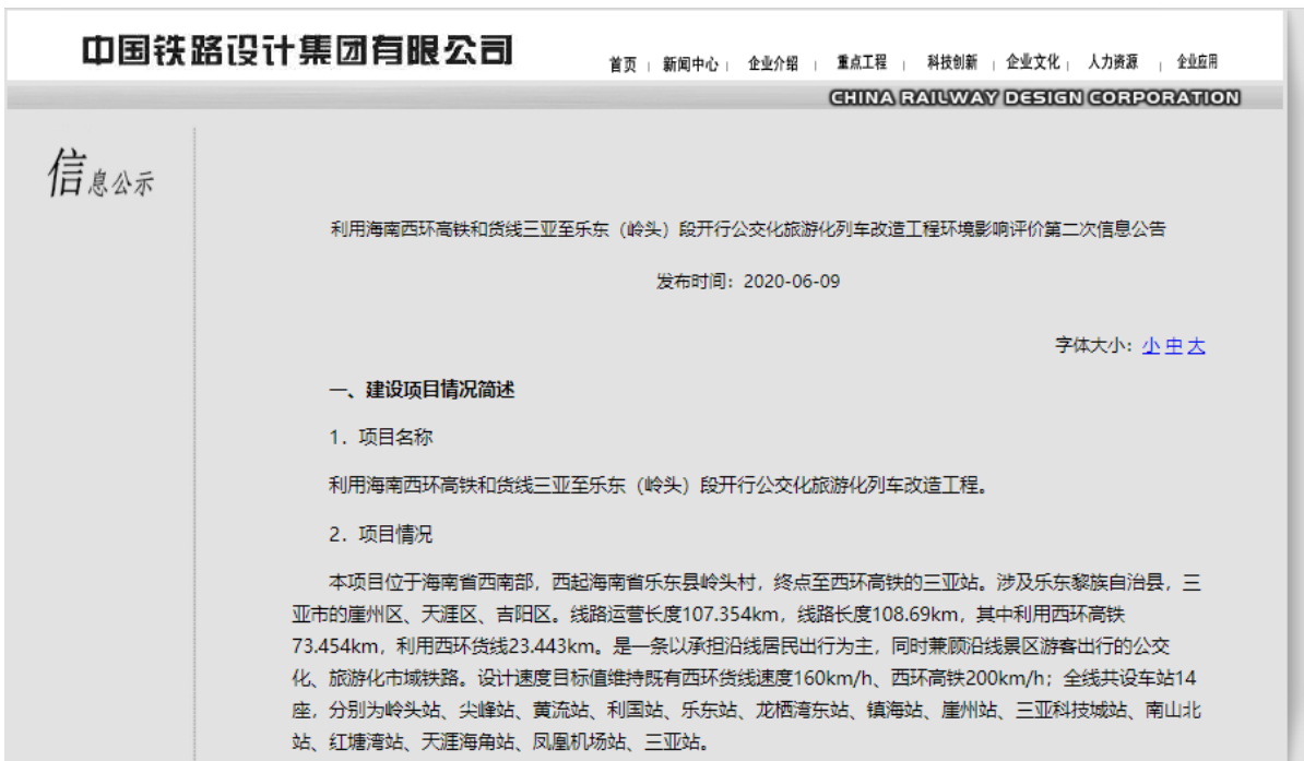
图 3-3 利用海南西环高铁和货线三亚至乐东（岭头）段开行公交化旅游化列车改造工程环境影响评价第二次信息公示（中国铁路设计集团有限公司网站）