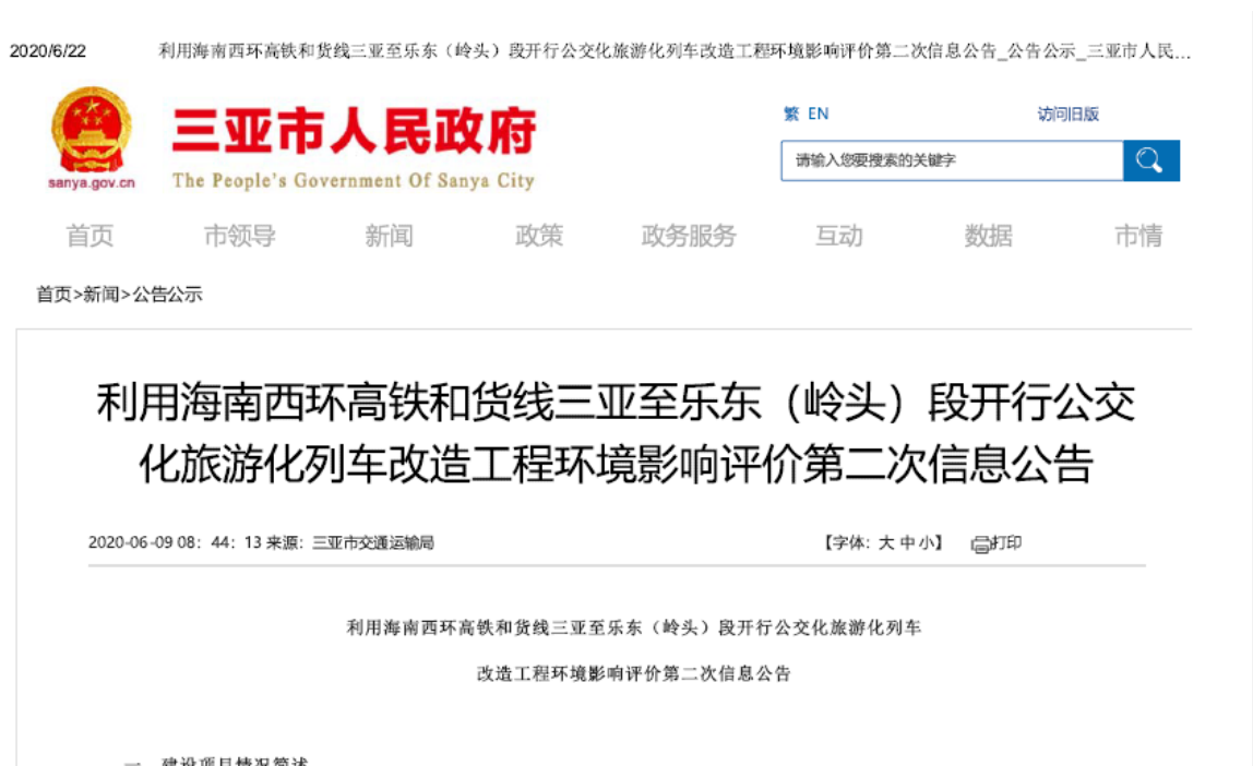
图 3-1 利用海南西环高铁和货线三亚至乐东（岭头）段开行公交化旅游化列车改造工程环境影响评价第二次信息公示（三亚市人民政府网站）

根据《环境影响评价公众参与办法》（生态环境部令第4号）第十一条，在三亚市人民政府网站（ http://www.sanya.gov.cn/ ）、乐东黎族自治县人民政府网站（ http://ledong.hainan.gov.cn/ ）、中国铁路设计集团有限公司（ www.tsdig.com ）进行网络平台公示。发布日期为2020年6月9日，公众提出意见的起止时间为2020年6月9日至2020年6月22日。网络平台公示的内容、格式和公开时间符合《环境影响评价公众参与办法》的相关要求。网络平台公示见图3-1~3-3。