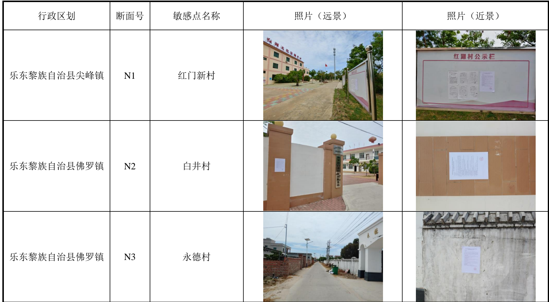
表 3-1. 公示张贴地点汇总表