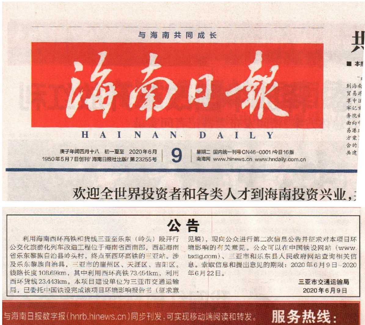
图 3-4 利用海南西环高铁和货线三亚至乐东（岭头）段开行公交化旅游化列车改造工程环境影响评价报告书征求意见稿公示 (2020 年 6 月 9 日海南日报)

根据《环境影响评价公众参与办法》第十一条要求，于 2020 年 6 月 9 日、2020 年 6 月 16 日分别在海南日报进行了信息公示。征求意见时间为 2020 年 6 月 9 日至 2020 年 6 月 22 日。满足登报 10 个工作日内公开信息不得少于 2 次的要求。2020 年 6 月 9 日登报见图 3-4，2020 年 6 月 16 日登报见图 3-5。