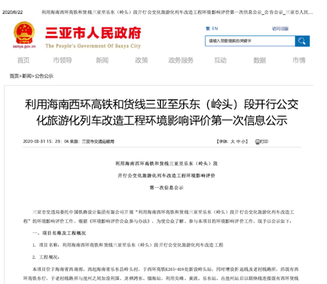
图 2-1 利用海南西环高铁和货线三亚至乐东（岭头）段开行公交化旅游化列车改造工程环境影响评价第一次信息公示（三亚市人民政府网站）

根据《环境影响评价公众参与办法》（生态环境部令第4号）第九条的相关要求，在三亚市人民政府网站、乐东黎族自治县人民政府网站进行网络平台信息公开，发布日期为2020年3月30日、3月31日。网络平台公开的内容、格式和公开时间符合《环境影响评价公众参与办法》的相关要求。网络平台公示见图2-1~2-2。